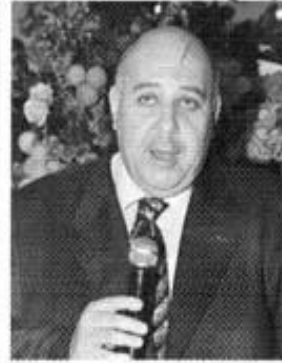
السفير المصري في لبنان أحمد البديوي